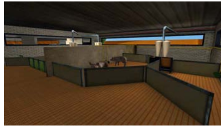
RMT élevages & environnement