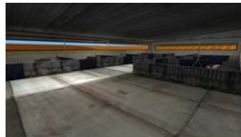
RMT élevages & environnement